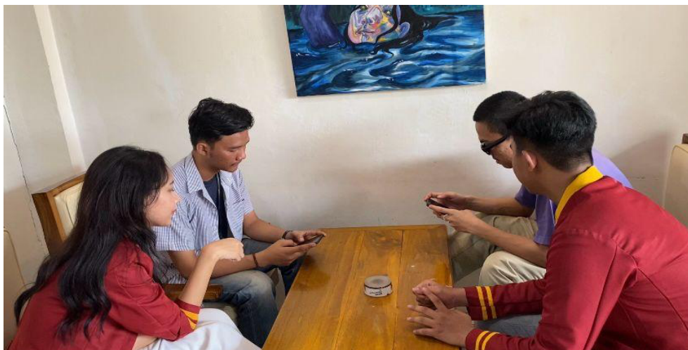
Gambar 3. Sesi Tanya Jawab dengan Peserta Pelatihan