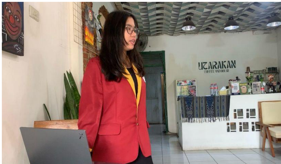
Gambar 2. Penyampaian Materi Pelatihan

bagi Utarakan Coffee and House. Pelatihan ini juga memberikan wawasan tentang pentingnya menggunakan aplikasi keuangan kasir pintar untuk mendukung pertumbuhan bisnis dan meningkatkan daya tarik pelanggan. Keunggulan dari aplikasi keuangan kasir pintar ini memungkinkan barista Utarakan Coffee and House untuk melacak stok barang secara real-time, memantau kondisi bisnis dengan lebih baik dan membuat keputusan yang lebih cepat berdasarkan data terbaru. Selain itu, aplikasi kasir pintar memberikan keamanan dalam sistem keuangan dan transaksi, serta memungkinkan barista Utarakan Coffee and House untuk lebih terkontrol terhadap transaksi dan stok barang. Selain itu, "Kasir Pintar" juga dapat membantu dalam manajemen stok, laporan penjualan, dan laporan keuangan harian. Pelatihan ini bertujuan untuk memberikan pemahaman dan keterampilan kepada barista dalam menggunakan aplikasi "Kasir Pintar" agar dapat memberikan manfaat yang signifikan dalam operasional bisnis, termasuk dalam hal profesionalitas, efisiensi, dan akurasi pencatatan keuangan. Aplikasi "Kasir Pintar" juga dapat membantu barista Utarakan Coffee and House dalam mengelola stok, mencatat transaksi, dan menganalisis laporan keuangan untuk mendukung pertumbuhan bisnis.