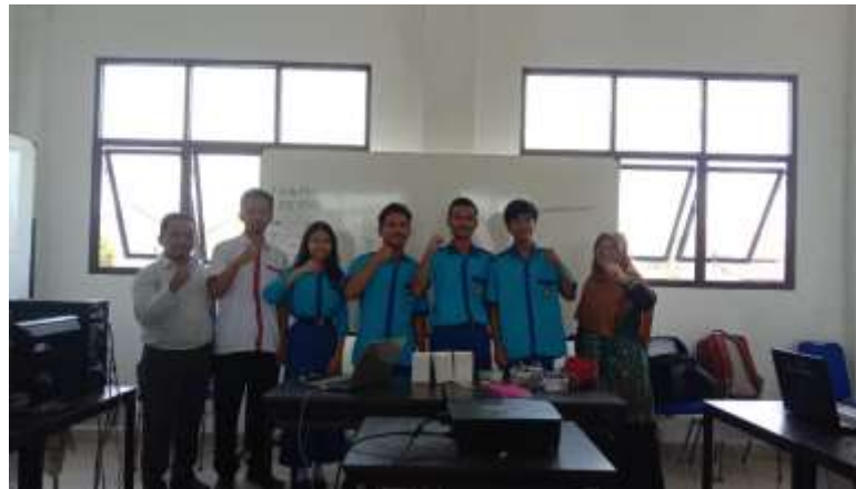
Gambar 8. Peserta terbaik mendapatkan Cendera Mata

Setelah pelaksanaan kegiatan selesai dilaksanakan, selanjutnya Tim PKM memilih peserta terbaik dalam rangka memberikan apresiasi kepada siswa/siswa yang telah antusias dalam mengikuti pelaksanaan kegiatan pelatihan. Pada kesempatan ini terpilih sebanyak 4 siswa/siswi terbaik yang telah mengikuti pelatihan dengan baik.