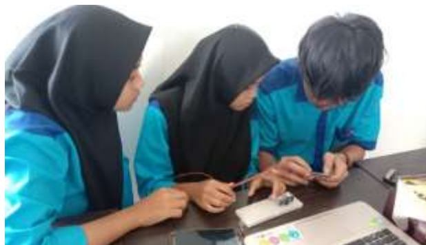
Gambar 5. Perakitan Perangkat IoT

Setelah pelaksanaan perakitan, kegiatan selanjutnya adalah dengan melakukan koding untuk di upload ke Mikrokontroler NodeMCU 8266. Setelah proses pembuatan koding, selanjutnya siswa diminta mendemokan hasilnya di depan kelas yang dipandu oleh pemateri.