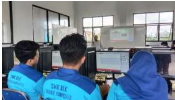
Gambar 4. Penjelasan Skematik Rangkaian