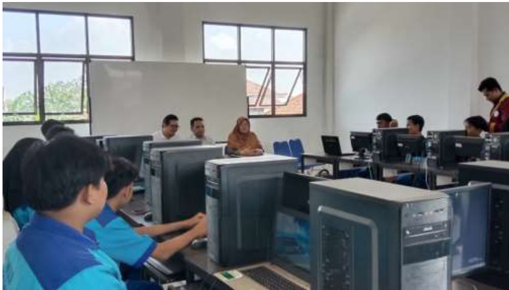
Gambar 2. Sambutan Kaprodi S1 Teknik Komputer