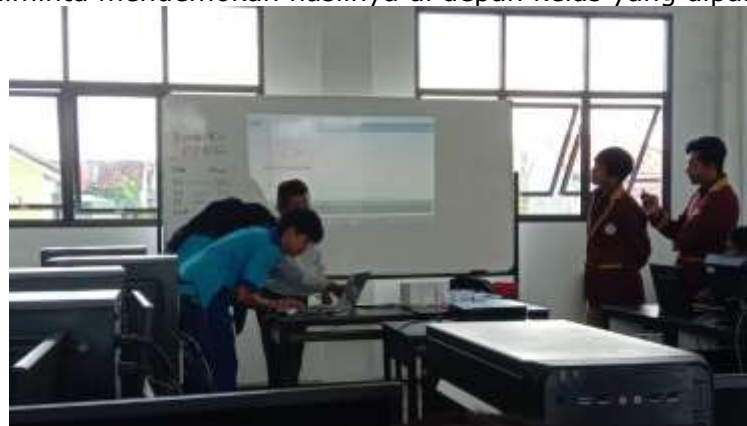
Gambar 6. Siswa Melakukan Demonstrasi terhadap Perangkat yang telah dibuat

Setelah pelaksanaan perakitan, kegiatan selanjutnya adalah dengan melakukan koding untuk di upload ke Mikrokontroler NodeMCU 8266. Setelah proses pembuatan koding, selanjutnya siswa diminta mendemokan hasilnya di depan kelas yang dipandu oleh pemateri.