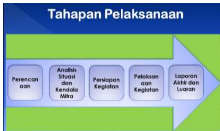
Gambar 1. Tahapan Pelaksanaan PKM

Metode pelaksanaan pengabdian dalam Program Kemitraan Masyarakat (PKM) ini terdiri dari lima tahapan kegiatan inti agar tercapai solusi yang diusulkan dalam pelaksanaan pengabdian ini, yaitu: Persiapan, Pelaksanaan, Pelatihan, Pendampingan, Pelaporan dan Publikasi terlihat pada gambar 1.