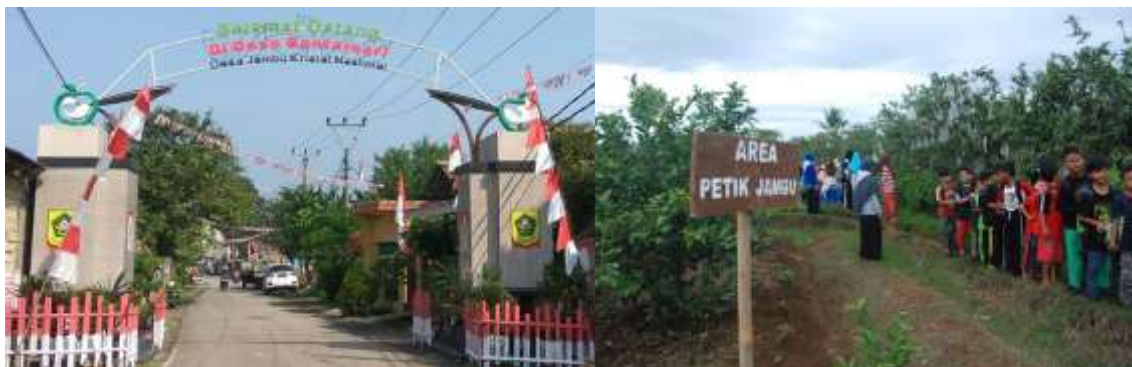
Gambar 1. Gapura Desa Bantarsari dan Area Hijau (Kiri dan Kanan)

Desa Bantarsari adalah salah satu desa wisata di Kabupaten Bogor. Desa ini merupakan salah satu desa wisata yang merupakan tempat wisata edukasi binaan wisatasekolah.com ini kita akan diperkenalkan dengan berbagai macam kegiatan seperti jelajah kebun jambu kristal, aktivitas memetik jambu kristal, memanen sayuran (kondisional) memanen kangkung dan serangkaian kegiatan fun games di lapangan terbuka. Lukman Hakim, S.Ag sebagai Kepala Desa Bantarsari (gambar 2) mengatakan bahwa kegiatan ini bertujuan untuk memperkenalkan Desa Bantarsari dan potensi pertanian seperti kebun jambu kristal dan sayur mayur. "Potensi desa dan pertanian disini dapat dijadikan sebagai sarana edukasi, sangat baik untuk proses pembelajaran anak-anak di alam terbuka yang tidak bisa diperoleh di sekolah". Dijelaskan Lukman, agrowisata ini harus dibangun untuk mengangkat nama baik desa, sehingga dapat menjadi alternatif bahwa ada sesuatu yang menarik disini selain di kota ( wisatasekolah.com , 2022).