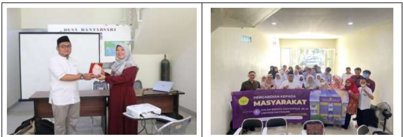
Gambar 4. Penyerahan Sertifikat dan Plakat