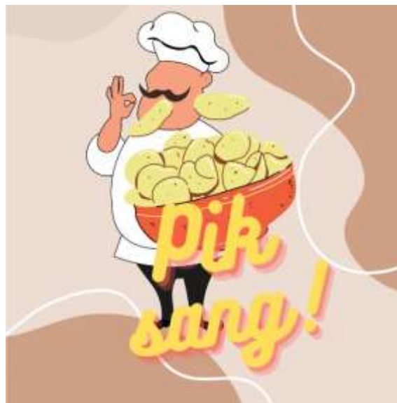
Gambar 6. Logo Usaha Mikro (Keripik Pisang)