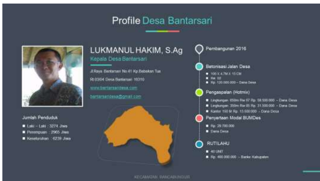
Gambar 2. Profile Desa Bantarsari