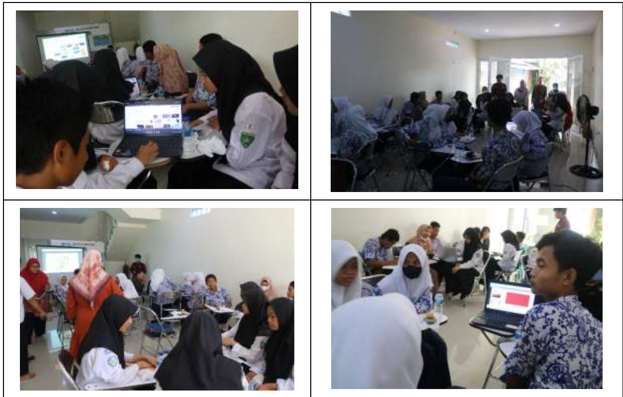
Gambar 5. Kegiatan Pelatihan

Kegiatan pengabdian dosen program studi Ilmu Komputer FMIPA ini terbagi menjadi 3 sesi kegiatan, yaitu: