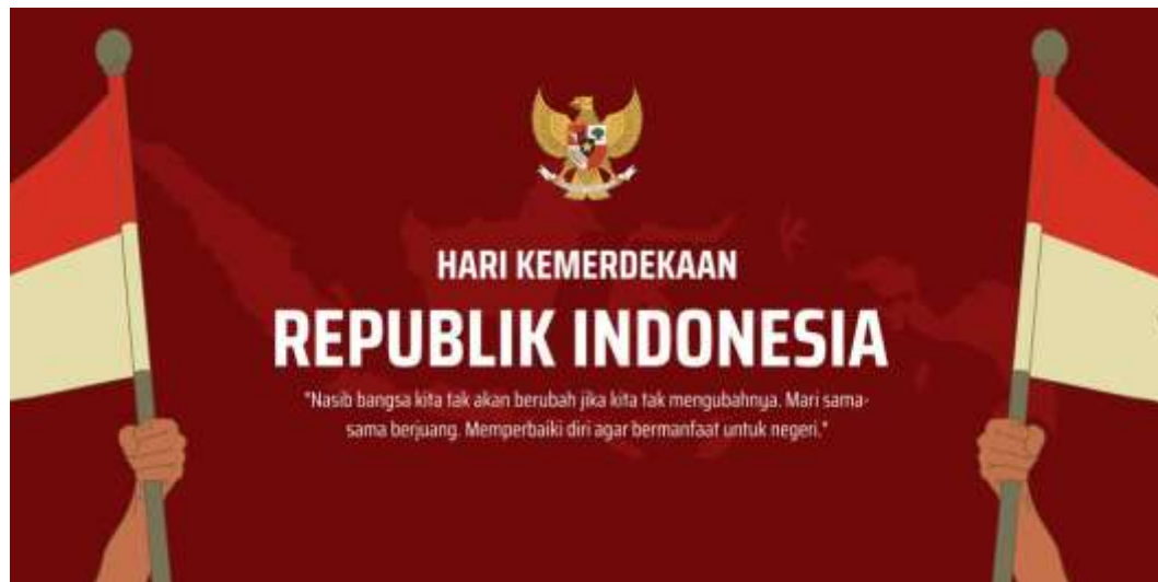
Gambar 8. Desain Hasil dari Pelatihan Canva

Pihak Desa Bantarsari memiliki harapan dapat diberikan support kembali untuk kedepannya setelah pelaksanaan kegiatan pengabdian ini, untuk membantu desa menerapkan teknologi informasi dan berbagai bentuk inovasi teknologi di era digital ini. Program studi Ilmu Komputer berharap bentuk pengabdian ini dapat memberikan manfaat yang besar bagi generasi muda di Desa Bantarsari, sebagai modal dalam membangun desa dan menerapkan serta memanfaatkan teknologi dalam mendukung pemerintah mensukseskan sistem informasi terintegrasi dan sosialisasi yang lebih komunikatif melalui media promosi.